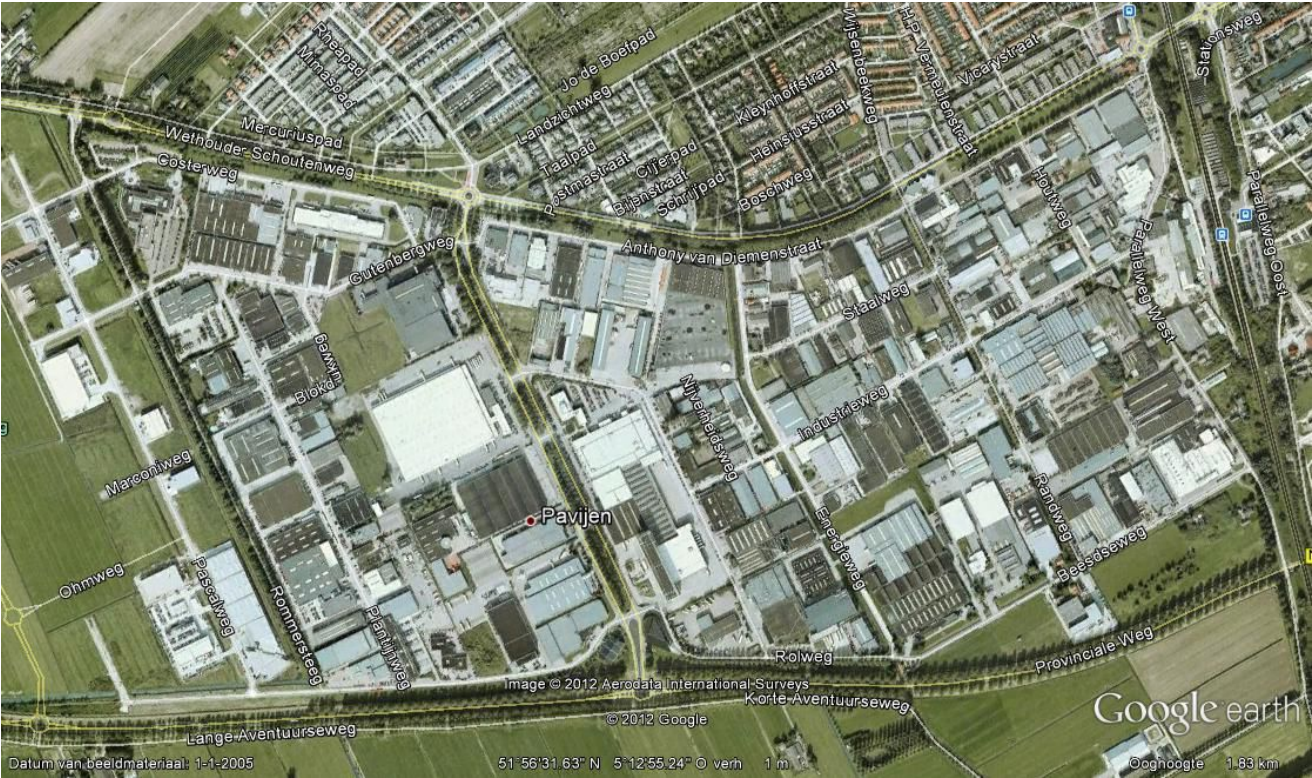
Luchtfoto bedrijventerrein Pavijen Culemborg